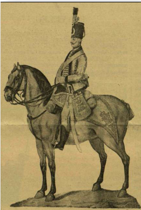
Székely huszár Mária Terézia idejéből