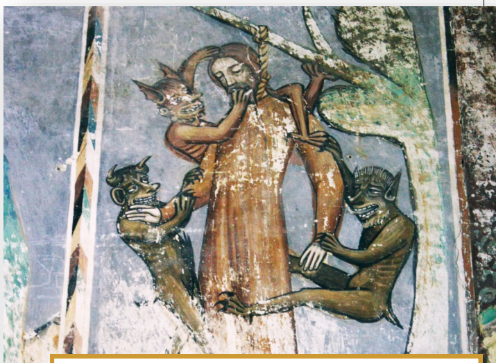
Almakerék (Mălâncrav, Malmkrog): Erdély egyik legszebb, freskókkal gazdagon díszített gótikus temploma. „A szentélyben jobban kivehetőek a képek, a bal oldali falon a passió jelenetei tűnnek fel, különösen kifejező például a felakasztott, ördögökkel körülvevett Júdás.”